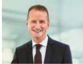
Dr.-Ing. Herbert Diess Chairman of the Board of Management of Volkswagen Aktiengesellschaft and Chairman of the Brand Board of Management of Volkswagen Passenger Cars, Volume brand group, China