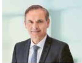
Oliver Blume Chairman of the Board of Management of Dr. Ing. h.c. F. Porsche AG, Sport & Luxury brand group